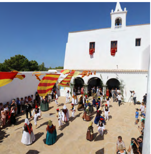
PUIG DE MISSA | SANT MIQUEL

SANT JOSEP La spiaggia di Cala d'Hort offre una vista impressionante sui mitici isolotti di Es Vedrà e Es Vedranell . Nel Parco Naturale di Ses Salines merita una speciale menzione la bellezza delle saline, nelle quali l'estrazione del sale prosegue ormai da seco-