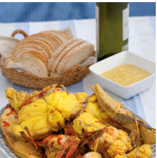
BULLIT DE PEIX