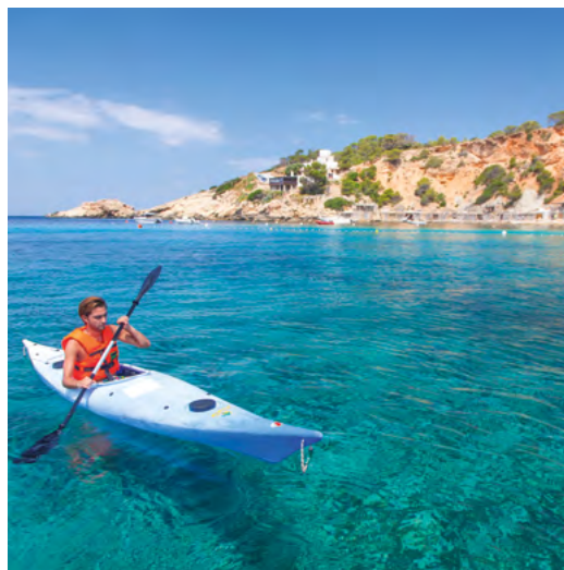
CALA D'HORT | SANT JOSEP

Le sol fertile de l'île ainsi que la richesse de ses fonds marins nourrissent le garde-manger des maisons et restaurants d'Ibiza avec une matière première d'excellente qualité. C'est pourquoi la gastronomie est devenue l'une des grandes attractions de notre destination, permettant au voyageur de savourer à la fois les plats typiques de l'île et la nouvelle cuisine contemporaine d'Ibiza ainsi que les propositions culinaires des coins les plus variés du monde. Déguster une paella de fruits de mer sur la plage, savourer les produits de la mer d'Ibiza avec une grillade de poisson ou avec un bullit de peix, partager un savoureux sófrít pagès, déguster les fromages de brebis et de chèvre de l'île ou sa savoureuse sobrasada, terminer le repas avec une portion de flaó et un verre d'herbes d'Ibiza, explorer les propositions suggestives de la haute cuisine, porter un toast avec un verre de vin de l'île... Il faut de nombreux voyages pour terminer le menu des délices qui vous attendent dans notre pays!