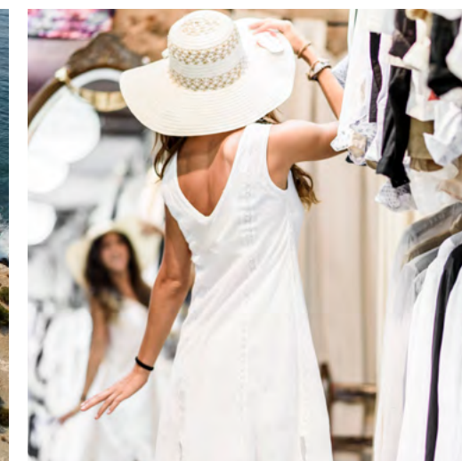
MODA ADLUB IBIZA

On y trouve aussi des boutiques et des stands pour acheter des produits artisanaux ou modernes et des cadeaux dans les zones de Dalt Vila , La Marina et sur L'Avenue Bartolomé Roselló , dans la commune d'Ibiza. À Sant Antoni, les produits artisanaux et les souvenirs se trouvent sur le Passeig de Ses Fonts , près de la zone commerciale. À Santa Eulària, les stands des artisans sont présents tous les jours en été sur le Passeig de S'Alamera .