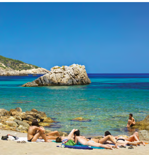
CALA XARRACA | SANT JOAN

Port de Sant Miquel et Cala de Sant Vicent sont des plages offrant tout type de service. Benirràs, S'Illo des Rençli ou Cala Xarraca sont d'autres criques charmantes.